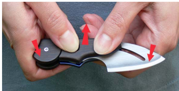
1. „Knicken“ sie das Messer wie dargestellt