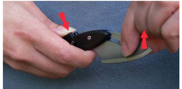
4. Drücken Sie den Griff zusammen