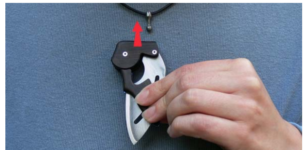
2. Lassen Sie den Anhänger einschnappen