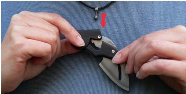
3. Lösen Sie das Messer vom Anhänger