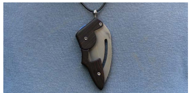
4. Nun hängt das Messer sicher am Anhänger