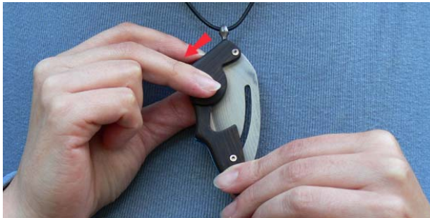
1. Entriegeln Sie das Messer am Schieber