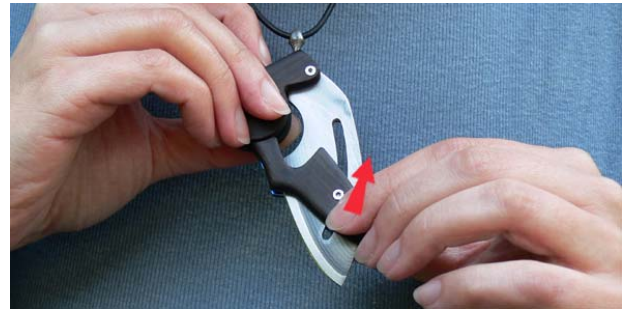
2. Öffnen Sie das Messer zur Hälfte