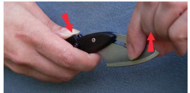
4. Drücken Sie den Griff zusammen