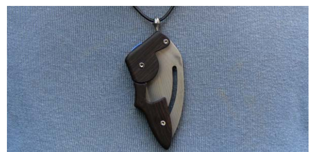
4. Nun hängt das Messer sicher am Anhänger