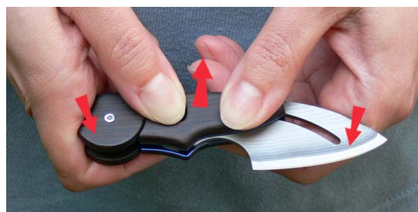
1. „Knicken“ sie das Messer wie dargestellt