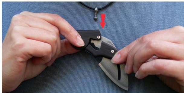
3. Lösen Sie das Messer vom Anhänger