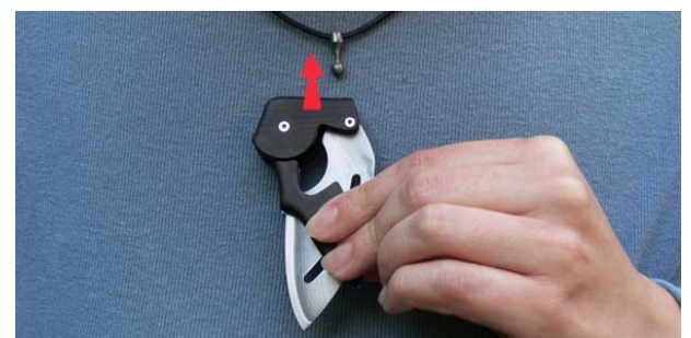
2. Lassen Sie den Anhänger einschnappen