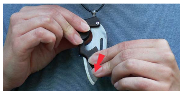
3. Schließen Sie das Messer, bis es einrastet