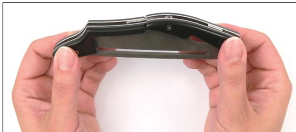
1. Halten Sie das Messer mit beiden Händen