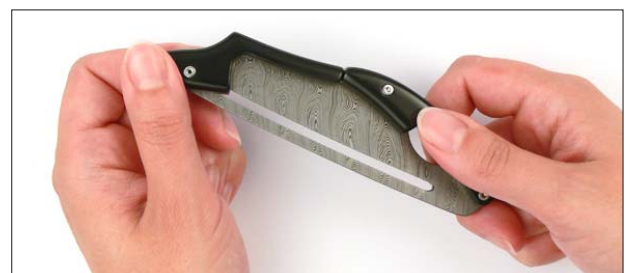
4. Der Schieber rastet ein