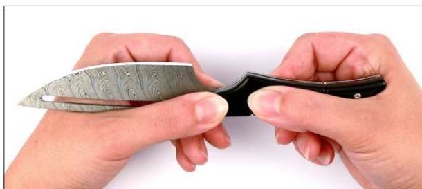
1. Halten Sie das Messer mit beiden Händen