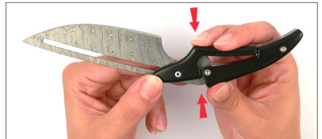
4. Drücken Sie den Griff zusammen