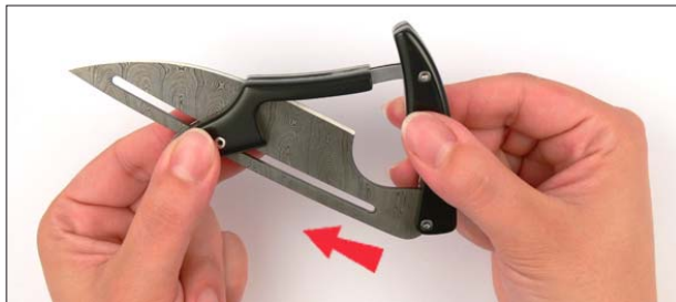
3. Schieben Sie die Klinge heraus