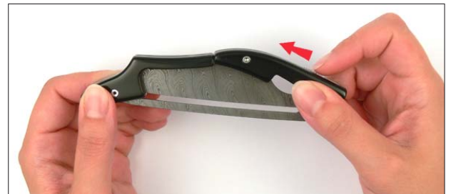
2. Entriegeln Sie es mit dem Schieber