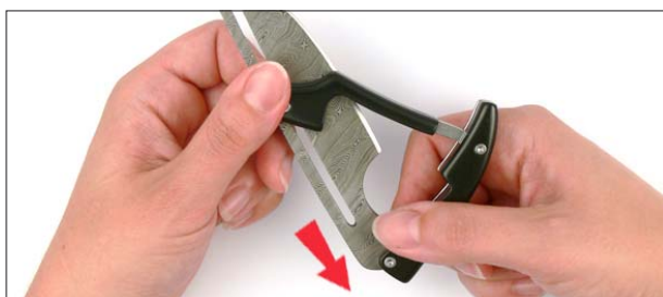
3. Ziehen Sie die Klinge zurück